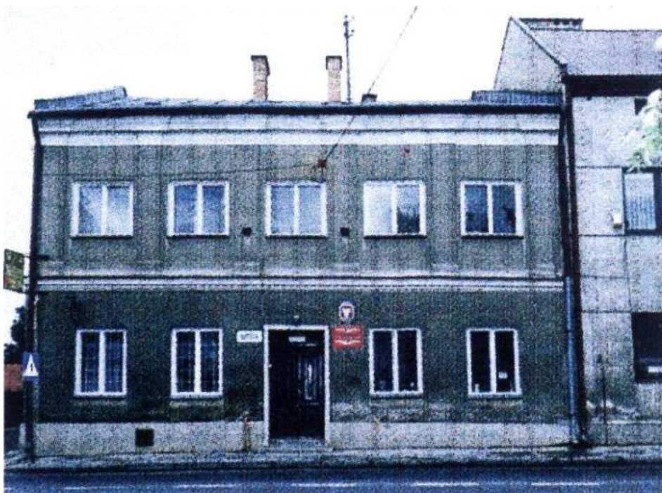
Fot. 1. Budynek Urzędu Gminy Kołaczyce (tutaj odbywała się nauka)

W 1880 roku zaczęto budować nowy, o wiele bardziej okazały jednopiętrowy dom, służący młodzieży Kołaczyc do 1975 roku (Fot.2). Była to oryginalna szkoła, w środku miała wieżyczkę z zegarem, a na samym szczycie chorągiewkę z blachy z wyciętą w środku datą budowy - 1880 rok. Szkoła w Kołaczycach była już wtedy czteroklasowa, koedukacyjna, ludowa. Ukończenie nauki szkolnej sześcioletniej dawało uprawnienia wstępu do gimnazjum, odpowiadającego dzisiejszej szkole średniej. Można było również wstąpić do dwuletniej szkoły wydziałowej męskiej. W 1880 roku szkoła w Kołaczycach zatrudniała 5 nauczycieli, a w 1895 roku było ich już 7. Do szkoły tej uczęszczało wtedy 120 dzieci mieszczańskich.